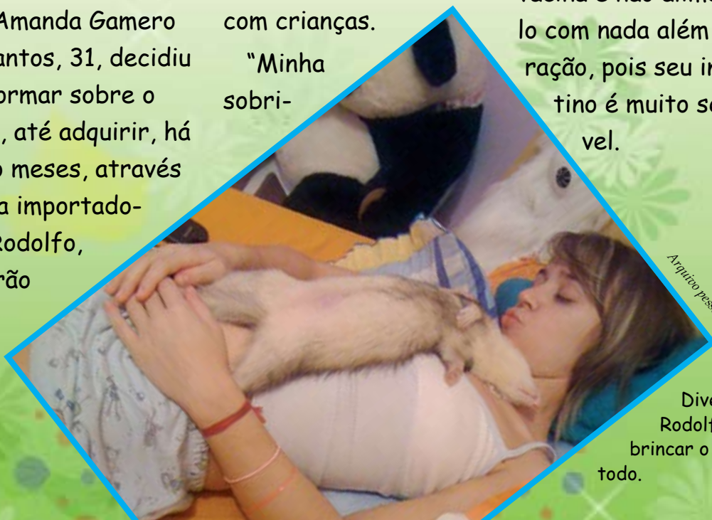
Divertido, Rodolfo quer brincar o tempo todo.

Então, é necessário tomar cuidado com portas e janelas. Também é importante dar vacina e não alimentá-lo com nada além de ração, pois seu intestino é muito sensível.